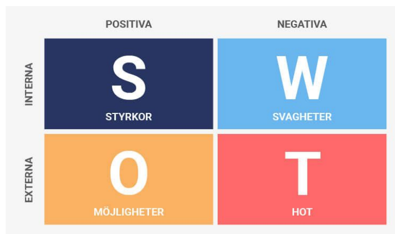
Figur 2: SWOT-modell (Jobber & Chadwick, 2013)